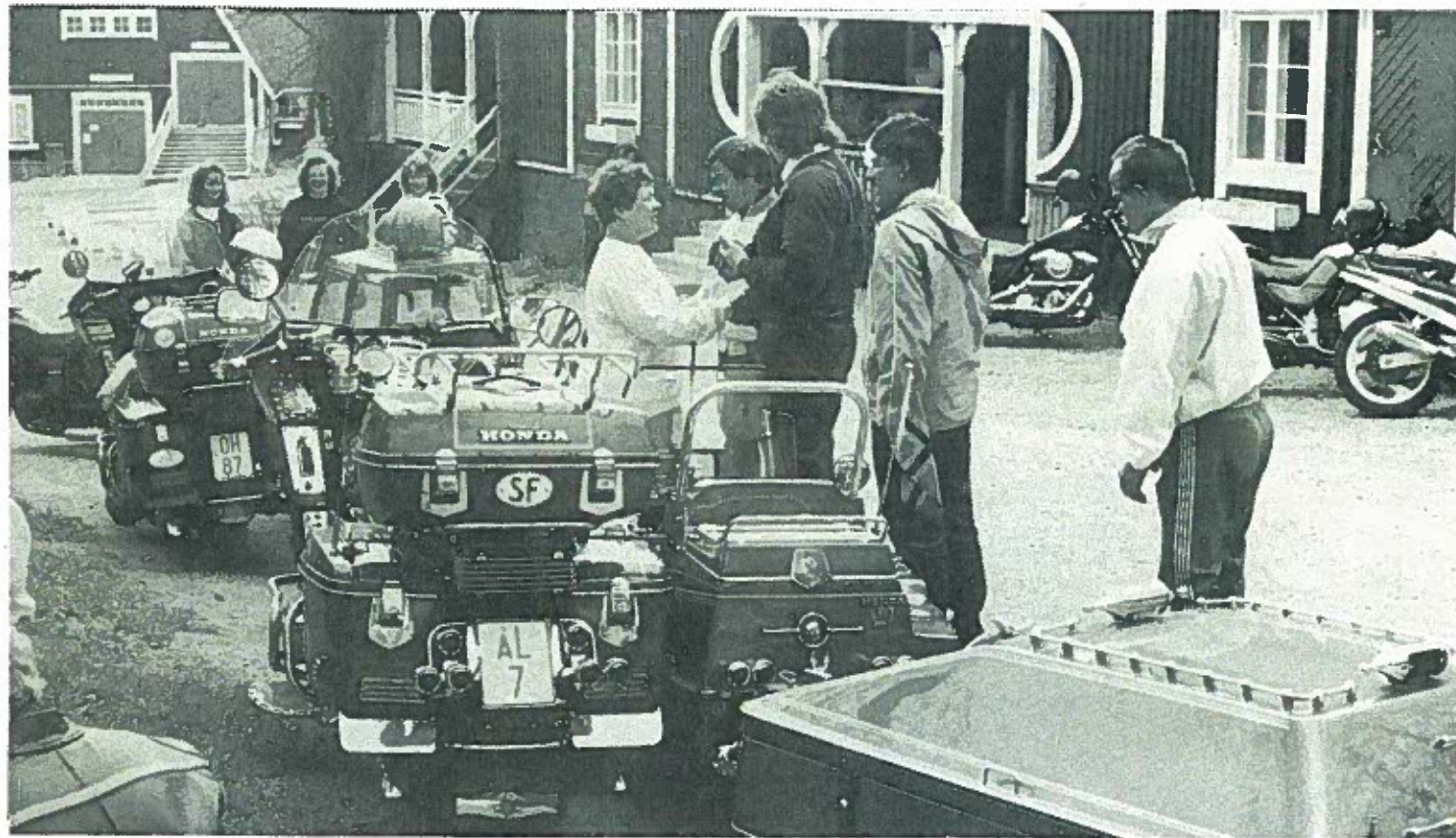
Teksti Heikki Arvelin