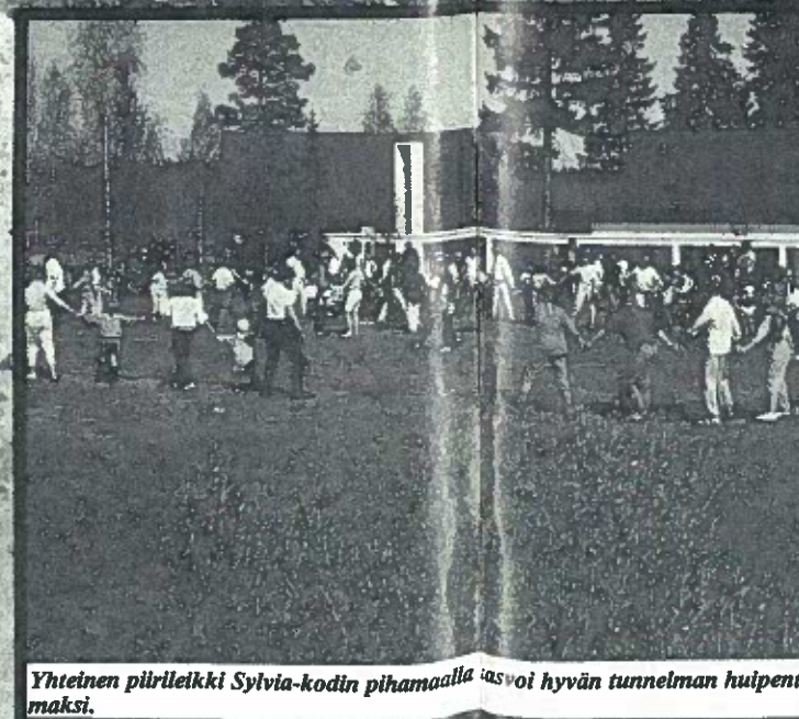
Yhteinen piirileikki Sylvia-kodin pihamaalla lasvoi hyvän tunnelman hulpenumaksi.

Jumbo Run, tilaisuus, jossa sivuvaunumotoristit viettävät päivän vammaisten lasten kanssa, pidettiin tänä keväänä Lahdessa.