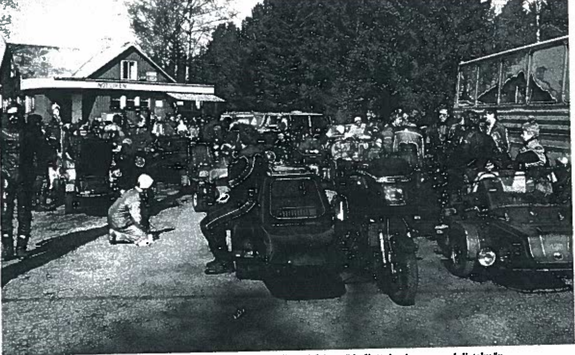
Jo lähtöalueella oli tunnelmaa. Kukin kyydittävä sai valita mieleisensä kuljettaja-sivuvaunu yhdistelmän.